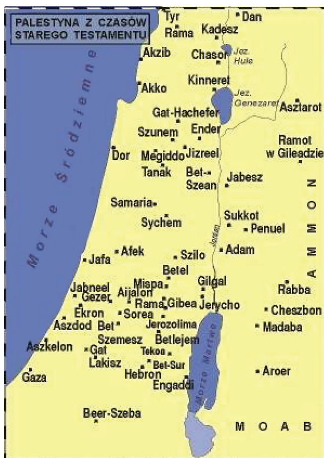
Rys. 1. Mapa Palestyny z czasów Starego Testamentu

W starożytności obecna Palestyna nosiła nazwę Kanaan. Ze względu na położenie geograficzne oraz znaczenie religijne była podbijana przez wiele ludów. Około 3200 r. p.n.e. została zasiedlona przez Kananejczyków. W XII wieku p.n.e. na terenach południowego wybrzeża Kanaanu zamieszkali Filistyni. Pod koniec XI wieku p.n.e. powstało na tym terytorium państwo żydowskie. W 1370 r. p.n.e. została podbita przez Hetytów, a około 587 r. p.n.e. przez Babilonię. W 538 r. p.n.e. weszła w skład imperium perskiego, a w 332 r. p.n.e. podbił ją Aleksander Macedoński. Następnie znalazła się pod panowaniem dynastii Ptolemeuszów, a później dynastii Seleucydów. Od 395 r. Palestyna stała się częścią cesarstwa wschodniorzymskiego, a w latach 634-640 została podbita przez Arabów.