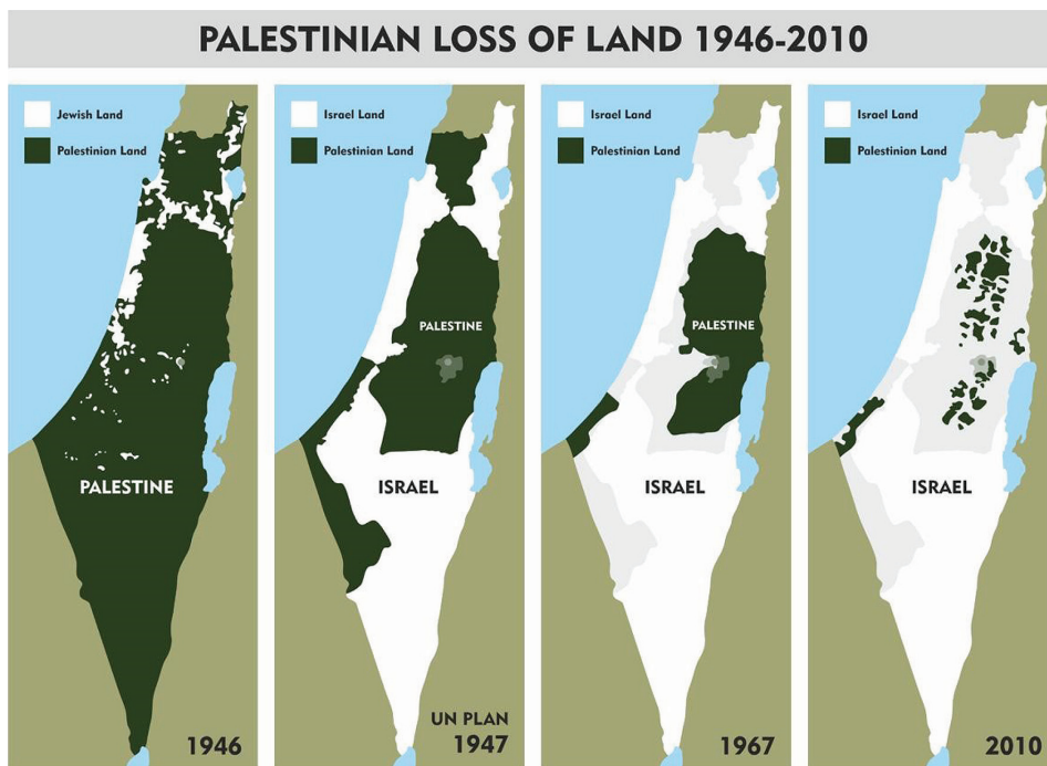
Rys. 4. Mapa Palestyny 1946-2010 17

Zmiany geograficzne i demograficzne w starożytnej Palestynie zmusiły bardzo dużą część społeczności palestyńskiej, szczególnie chrześcijan, do opuszczenia kraju i szukania bezpiecznego i lepszego życia, co z kolei przyczyniło się do zmiany kulturowej oraz narastania podziałów i wrogości między mieszkańcami, którzy wcześniej razem budowali historię i kulturę tego kraju.